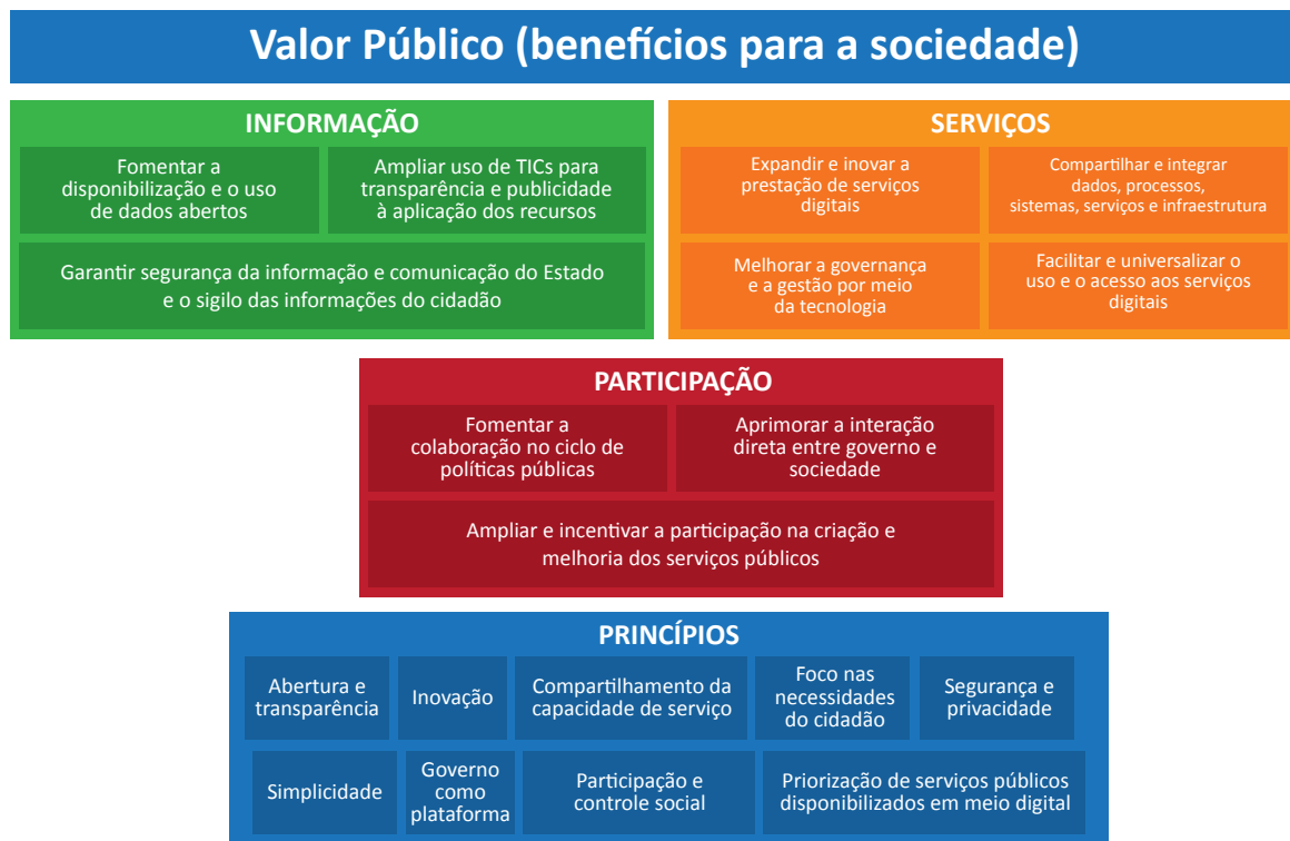
Figura 3 - Diagrama Estratégico